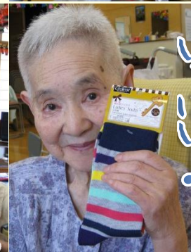
楽しい行事 もうたよ!