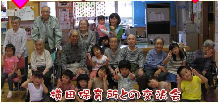
横田保育所との交流会