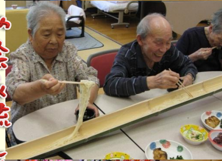
夏祭り運動会&流しそばめん