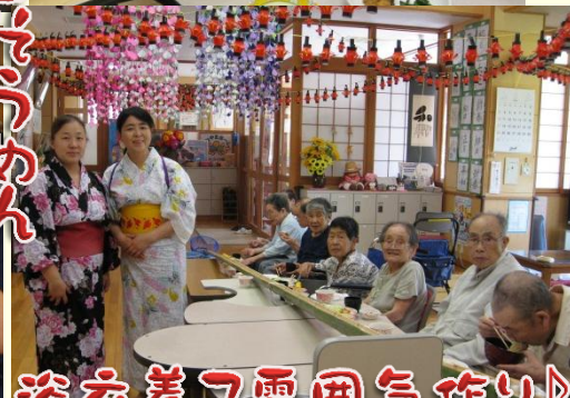
浴衣着て雰囲気作り!