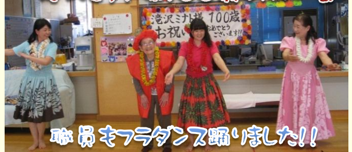
職員モダンダンス踊りました!!