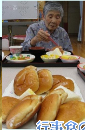
行事食のパンバイキング♡