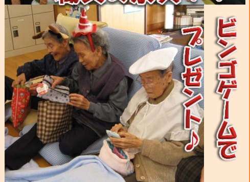
ビンゴゲームで プレゼント♪